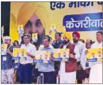
दिल्ली के मुख्यमंत्री व आप सुप्रीमो अरविंद केजरीवाल ने राजस्थान में आम आदमी पार्टी की गारंटी कार्ड लॉन्च किया।